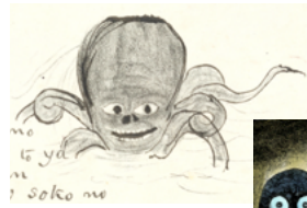
小泉八雲画「ウミボウス」(「妖魔詩話」)